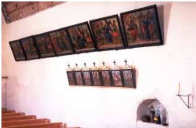
Stationsbilder des Kreuzweges an der Nordwand, rechts unten der Eingang zum Unglücksstollen.

Beachtung verdient auch die Kreuzigungsgruppe auf der Traverse unmittelbar vor dem Chorbogen. Sie zeigt ein aus dem frühen 17. Jahrhundert stammendes spätgotisches Kruzifix in beeindruckender Darstellung, flankiert von noch älteren, kleineren Figuren der Gottesmutter und des hl. Johannes.