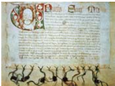
Ablassbrief von 1332. Von den Siegeln der Aussteller sind noch die Hälfte teilweise erhalten. Initiale: Haupt Christi als Lehrer.