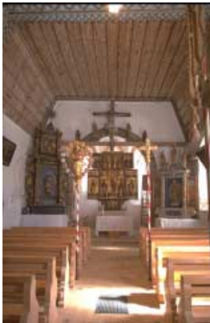
Innenansicht des Kirchleins mit den drei Altären, der Kreuzigungsgruppe an der Chorbogenwand, Rosenkranzmadonna und Vortragekreuz.

angebracht. Die beiden Flügel des Hauptschreines zeigen auf der Rückseite Maria und den Engel Gabriel bei der Verkündigung der Menschwerdung Christi. Auf der Rückseite der Flügel des oberen Altarschreines sind einfache Band- und Rankenornamente in gotischer Manier.