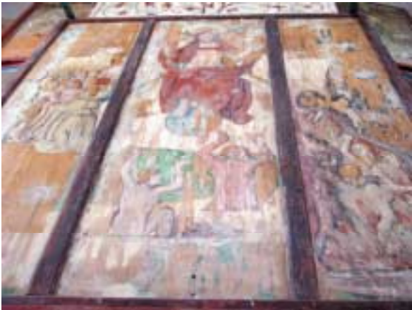
Rückseite des Hauptschreines