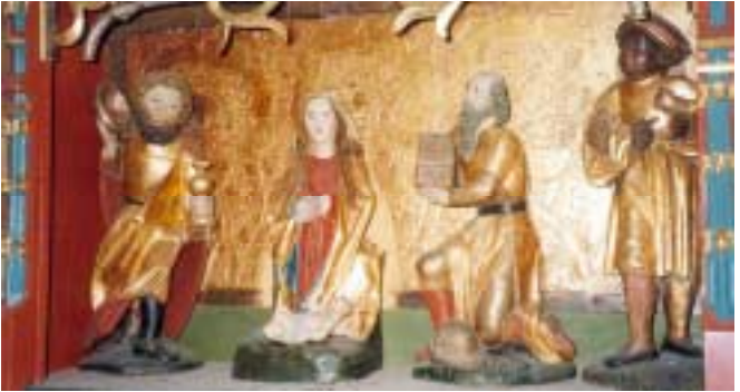
Anbetung der Weisen