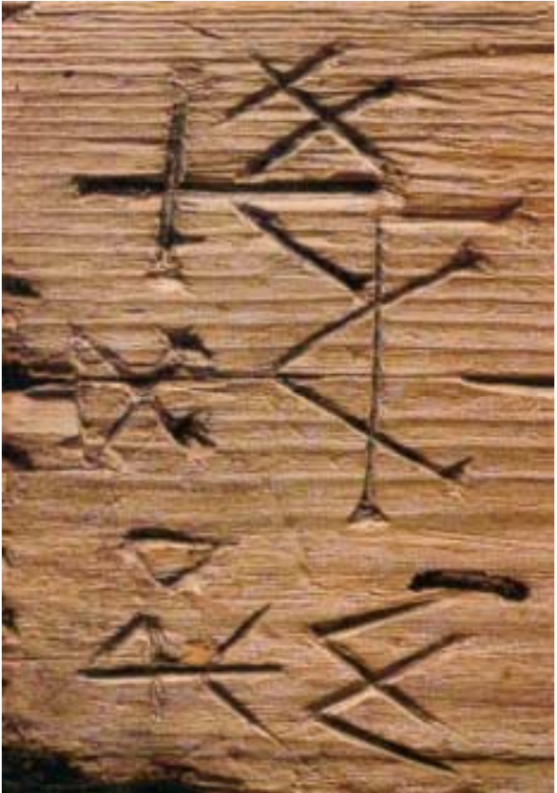
Hauszeichen in der Vorhalle