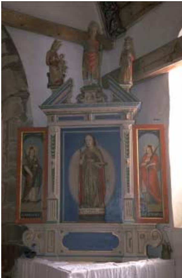
St. Agatha - Altar