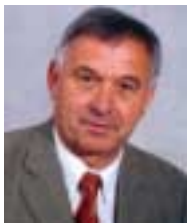
Bürgermeister Willi Säly